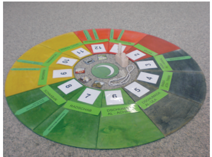
Beispiel Jahreskreis Islam