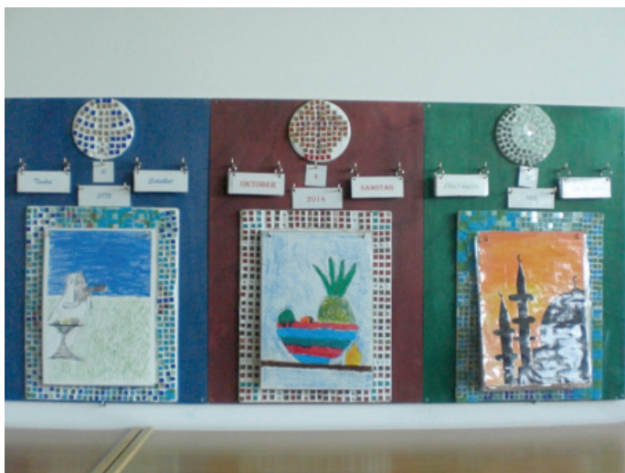
Das Ergebnis einer erfolgreichen Projektarbeit: der Kalender für drei Religionen

In fünf Gruppen erarbeiten die Kinder die Inhalte für den Wandkalender, bauen die einzelnen Bestandteile und setzen den Kalender zusammen. Ergänzend zum Wandkalender entsteht der Jahreskreis, der die Feste der Religionen im Jahr zeigt. In der Projektarbeit erforschen die Kinder spielerisch die bedeutsamen Festtage der Religionen, erkunden Gemeinsamkeiten und Unterschiede.