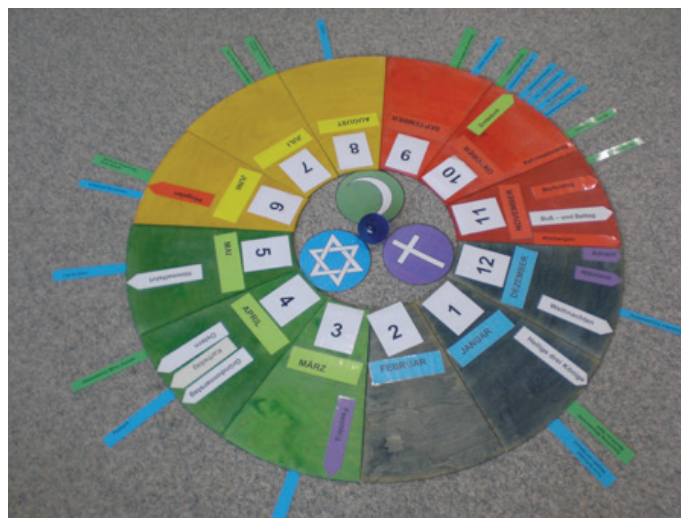
Die Feste der drei Religionen übersichtlich im Jahreskreis