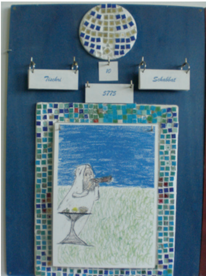
Rückwand aus Sperrholz mit Haken, blau grundiert