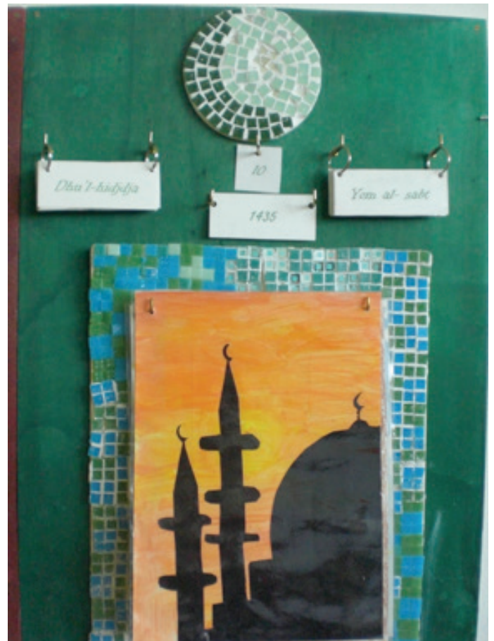
Mosaiksteinchen als Hintergrund der Festtagsbilder

Grundlage Wochentage der drei Religionen siehe Kapitel WT3.