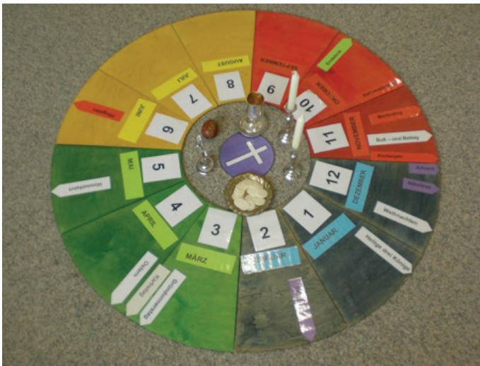
Beispiel Jahreskreis Christentum