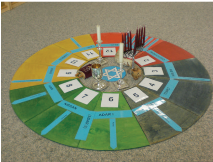
Beispiel Jahreskreis Judentum