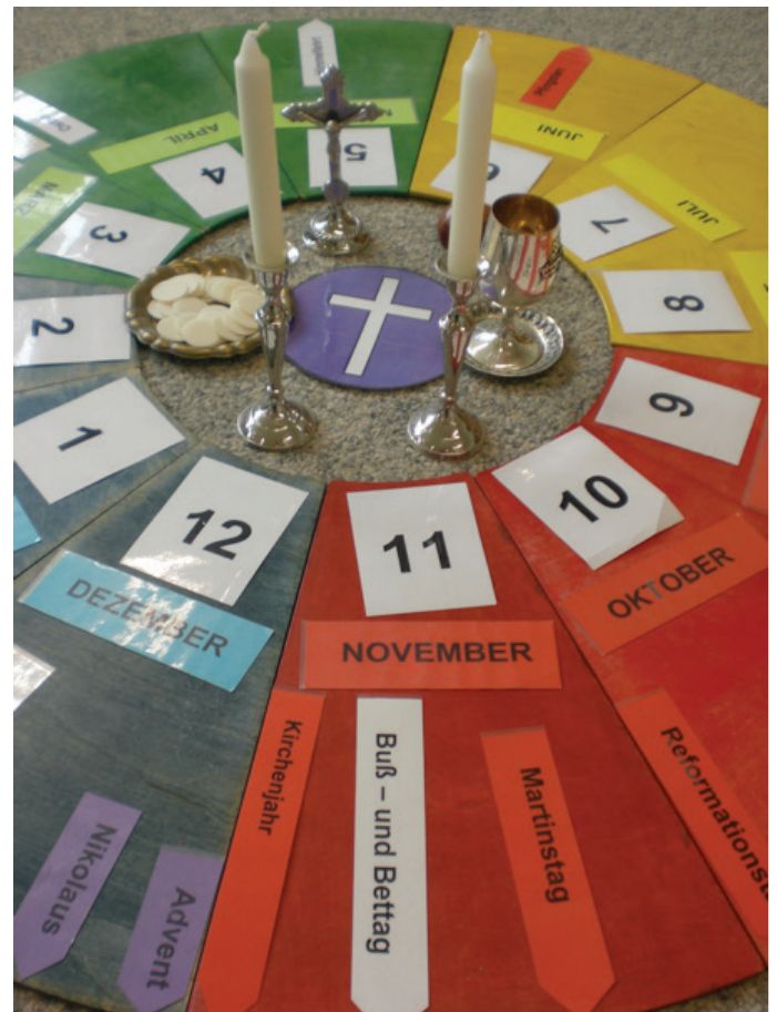
Beispiel Jahreskreis Christentum Detailansicht Monat November mit Festnamen