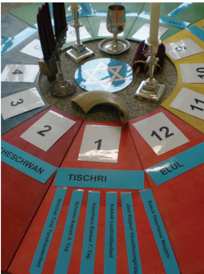
Beispiel Jahreskreis Judentum Detailansicht Monat Tischri mit Festtagen