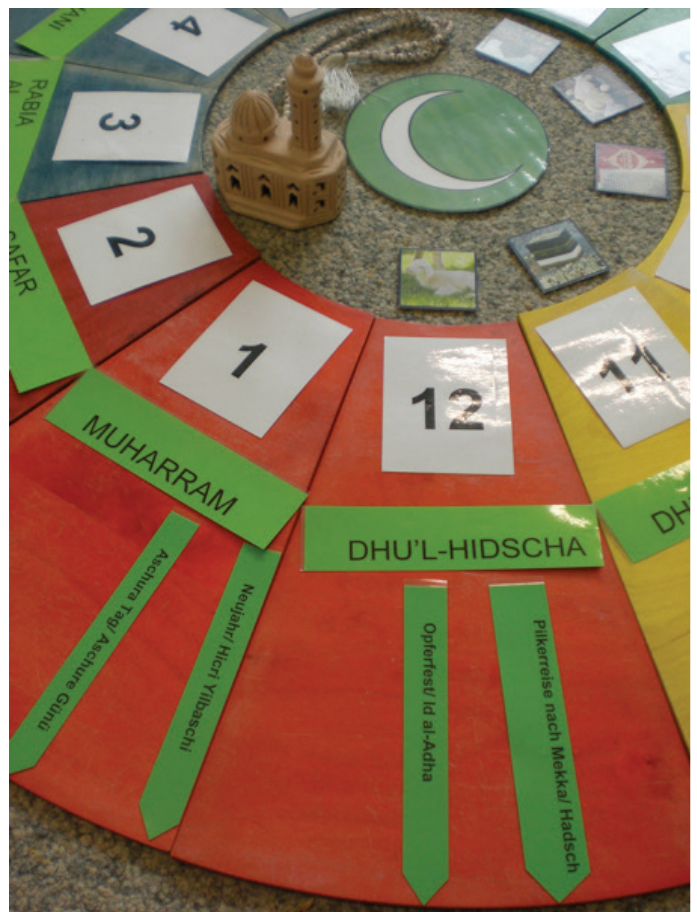
Beispiel Jahreskreis Islam Detailansicht Monat Dhu'l-Hidscha mit Festnamen